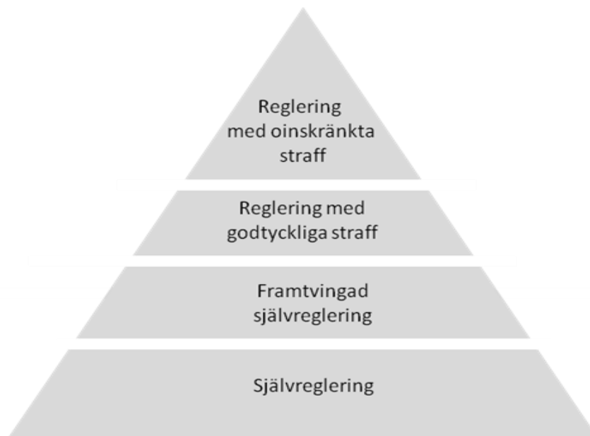
figur 2.1 Ayres & Braithwaites bekämpningspyramid (Ayres & Braithwaite 1992, s.39, fritt översatt författarna)

Konceptet med skam inkorporerar Ayres & Braithwaites i sin bekämpningspyramid, vilket är något vi ska beröra i följande avsnitt.